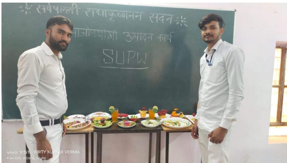
vivo Y51 - KIRTY KUMAR VERMA Feb 09, 2023, 12:19