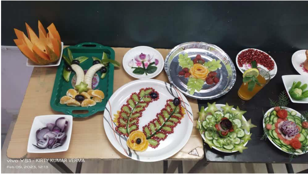
vivo Y51 - KIRTY KUMAR VERMA Feb 09, 2023, 12:13